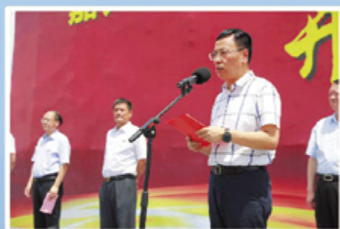
嘉兴市人民政府副市长邢海华讲话