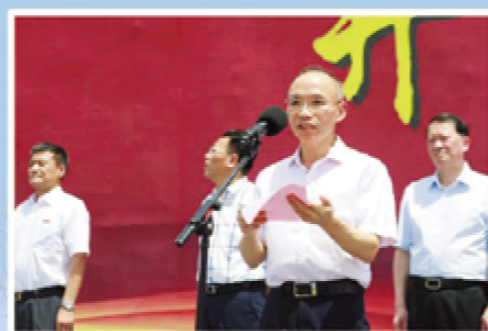
省教育厅副巡视员吴永良讲话