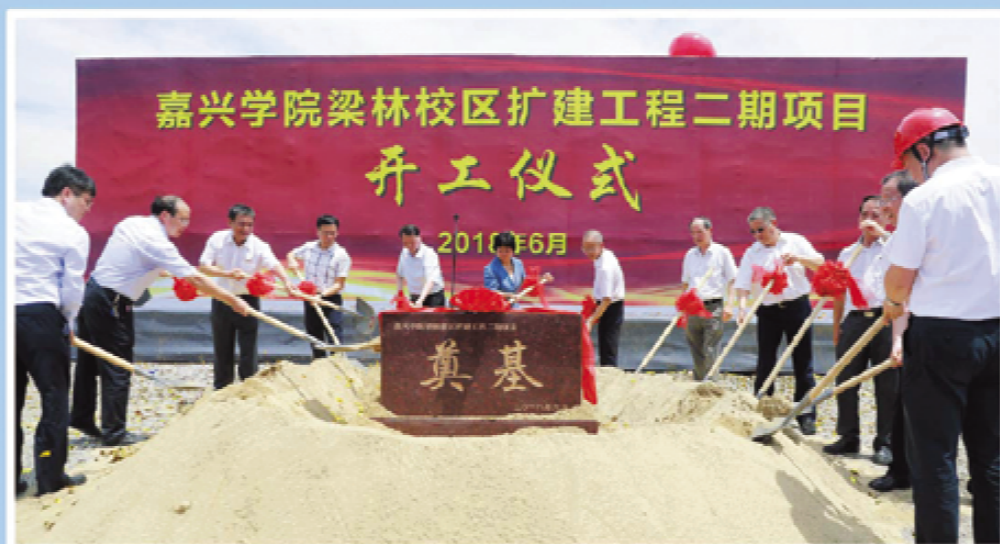
领导与嘉实共同培土奠基