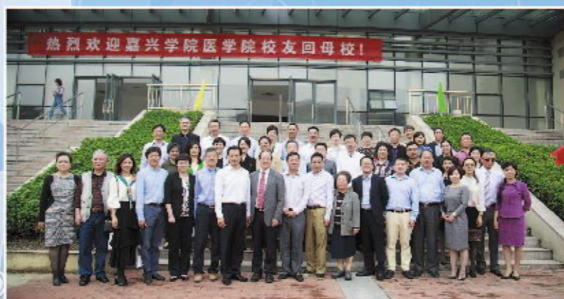
参加庆典活动的部分代表合影