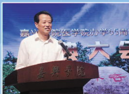
嘉兴市委副书记孙贤龙校友发言