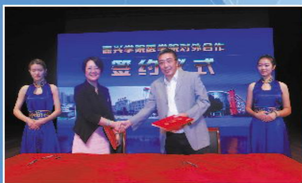
对外合作签约仪式